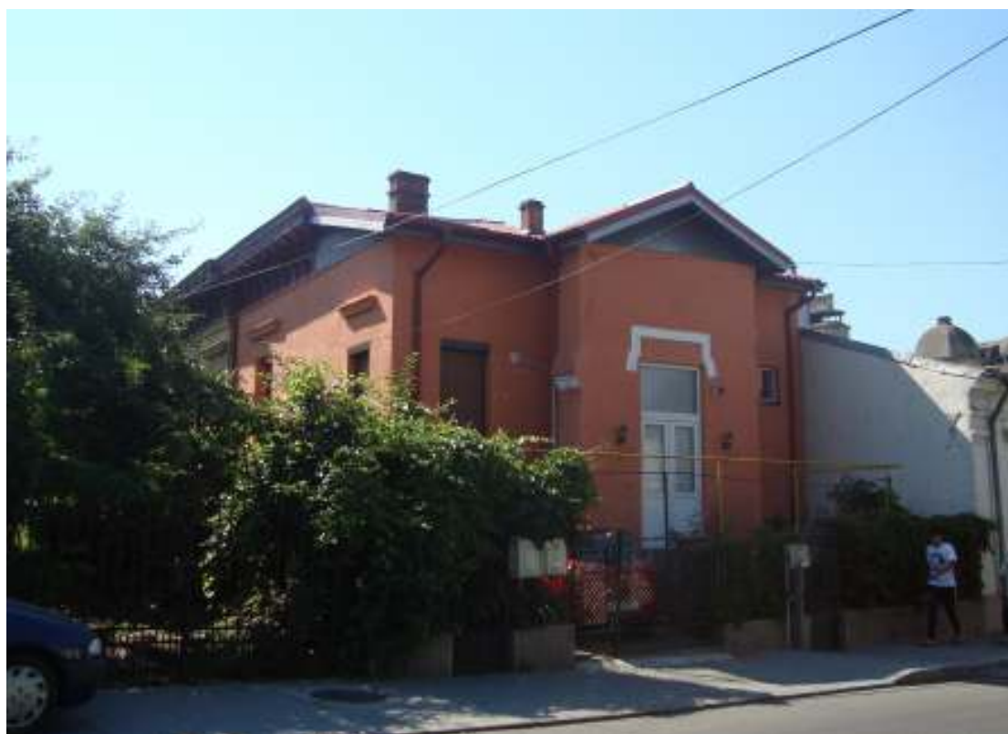
Fotografia actuală cu casa situată în Craiova, strada Simion Bărnuțiu, nr.33, (fost Gheorghe Chițu, nr.23), în care a locuit Anghel Betolian