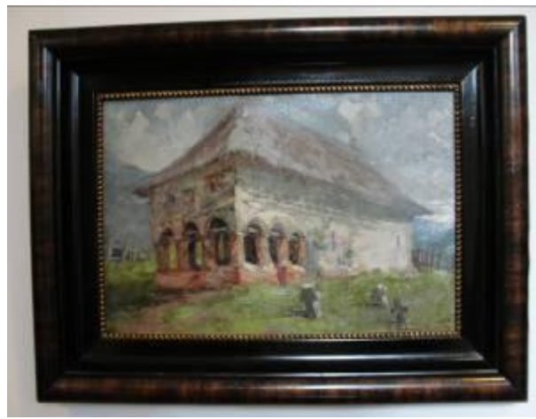
C. Teodorescu-Romanați (Biserică de sat)