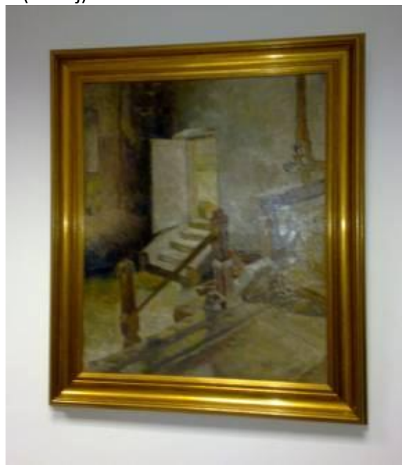
C. Teodorescu-Romanați (Interior)