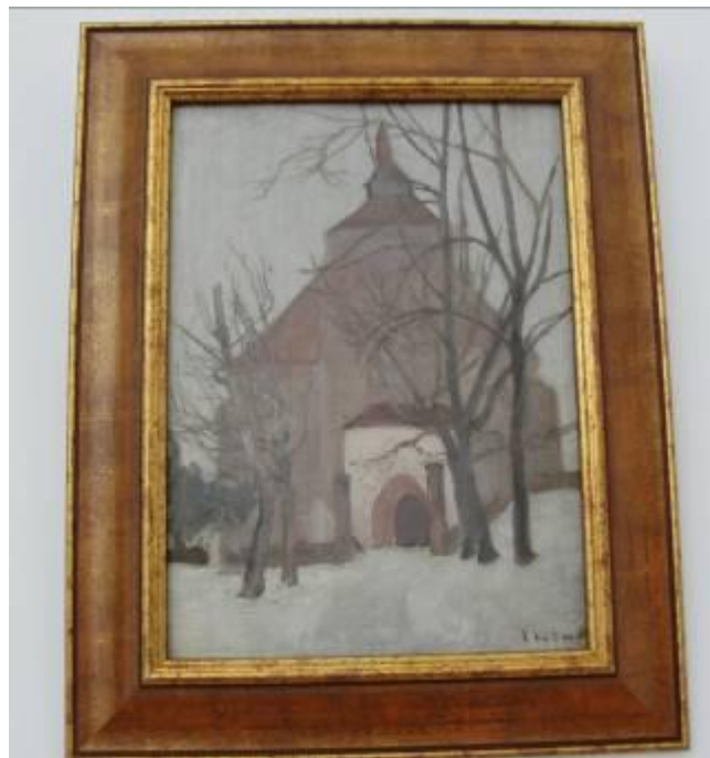
D. Stoica (Biserică)