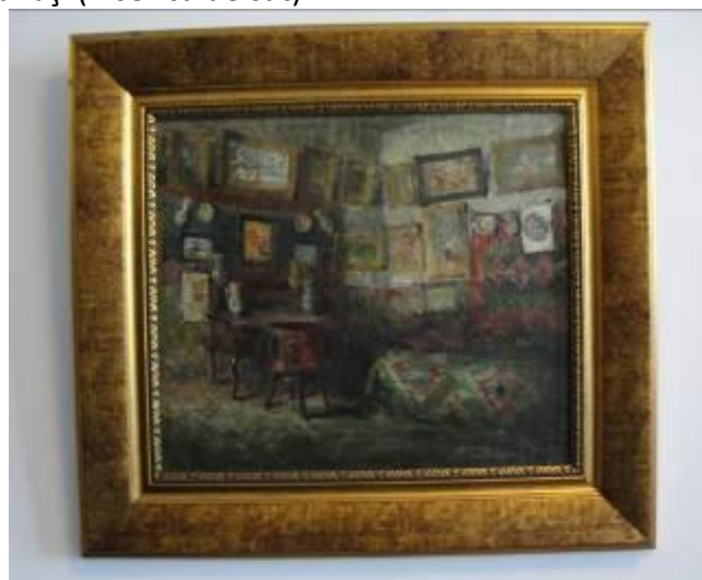
C. Teodorescu-Romanați (Atelier)