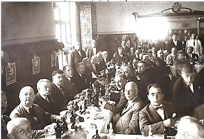
Invitații la masa oferită de Primăria Municipiului Craiova, în onoarea D-lui Ministru al Justiției Stelian Popescu – fotografie din Albumul Congresul General al Avocaților din România, Craiova, 7,8 și 9 septembrie 1928