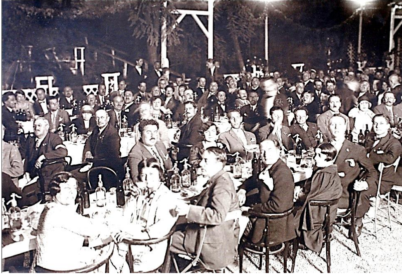
Banchetul oferit de Baroul Dolj Congresiștilor în Grădina "Astoria" – fotografie din Albumul Congresul General al Avocaților din România, Craiova, 7,8 și 9 septembrie 1928