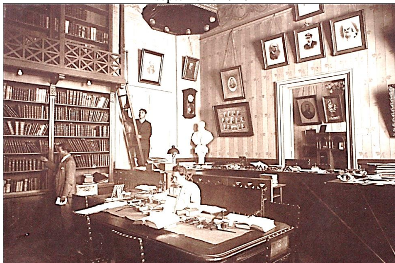
Sala Consiliului de Apel și Biblioteca Decanatului Baroului Dolj – fotografie din Albumul Congresul General al Avocaților din România, Craiova, 7,8 și 9 septembrie 1928