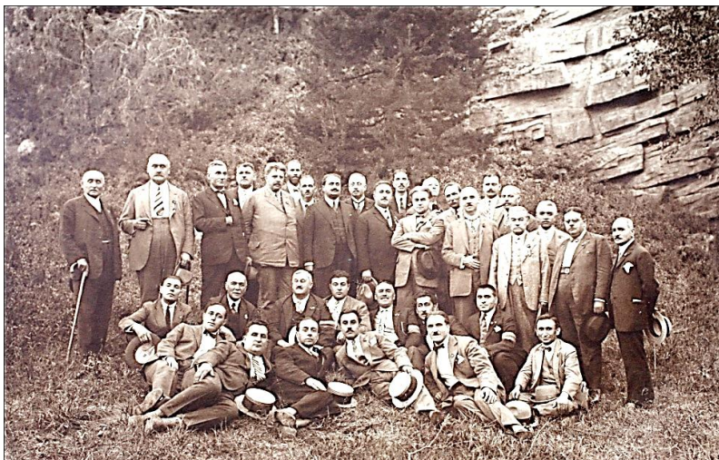
Membrii Consiliului General al Uniunii în Parcul Bibescu – fotografie din Albumul Congresul General al Avocaților din România, Craiova, 7,8 și 9 septembrie 1928