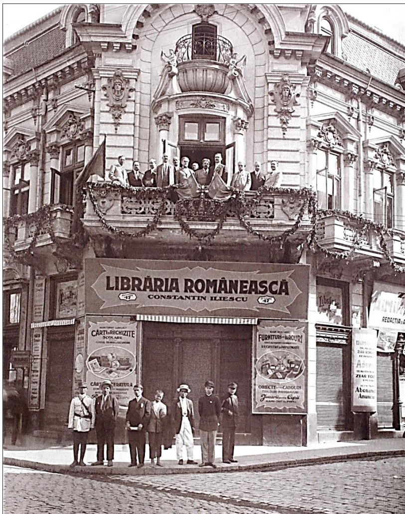
Membrii Comisiunii Permanente a Uniunii la Cercul Avocaților din Dolj – fotografie din Albumul Congresul General al Avocaților din România, Craiova, 7,8 și 9 septembrie 1928