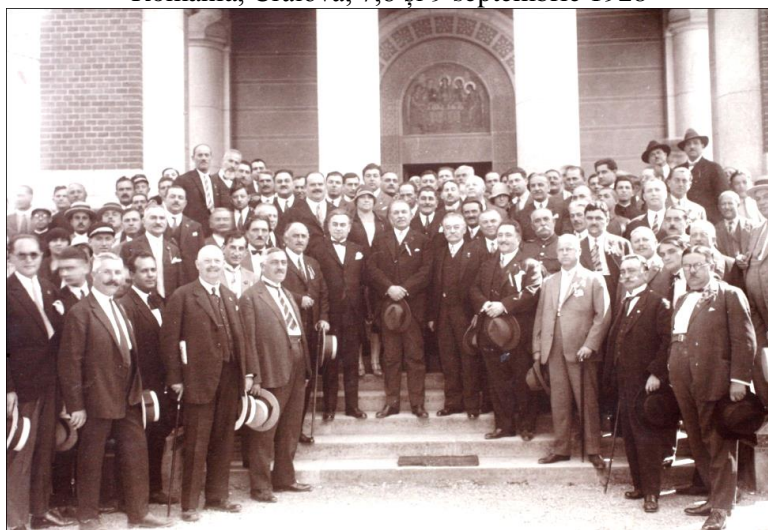
Congreșiștii avocați în fața Bisericii Sf. Treime – fotografie din Albumul Congresul General al Avocaților din România, Craiova, 7,8 și 9 septembrie 1928