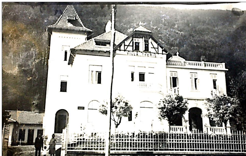
Vila Themis, proprietatea Baroului Dolj – fotografie din anii 1930