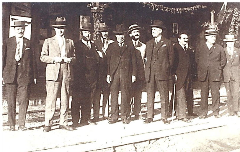
Magistrați și avocați în Gara Craiova – fotografie din Albumul Congresul General al Avocaților din România, Craiova, 7,8 și 9 septembrie 1928