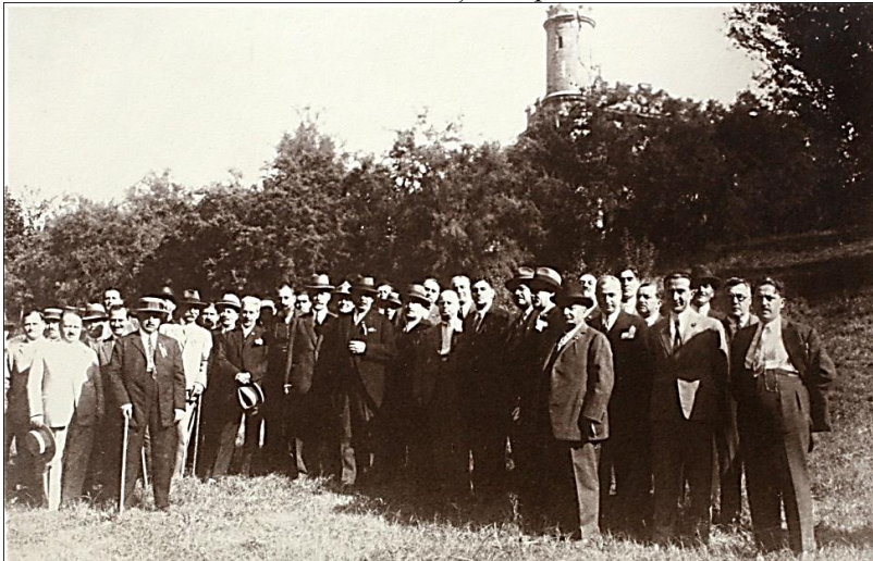
D-l Ministru al Justiției cu o parte din Congresiști în Parcul Bibescu – fotografie din Albumul Congresul General al Avocaților din România, Craiova, 7,8 și 9 septembrie 1928